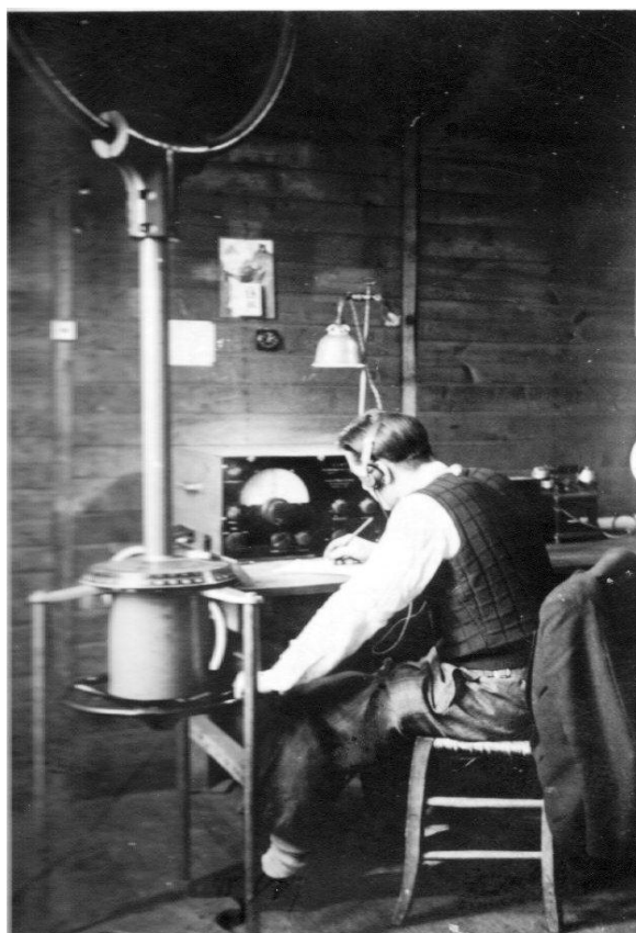
Les écoutes au GCR de Bouillargues (Gard), en 1944