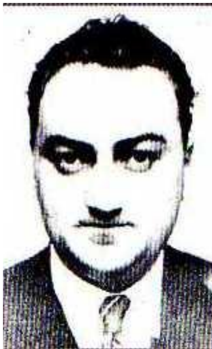
Le commandant André MESNIER à la Direction des Services de l'Armistice, en 1941 [Agenda des Transmissions, 2009]