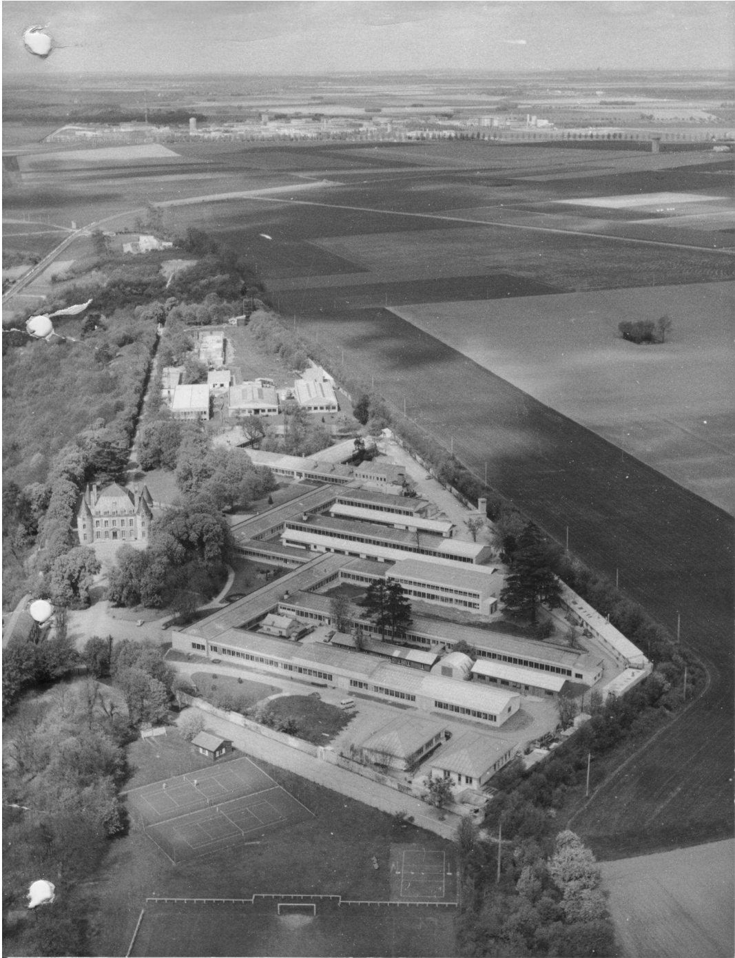
Vue aérienne avec Saclay en perspective