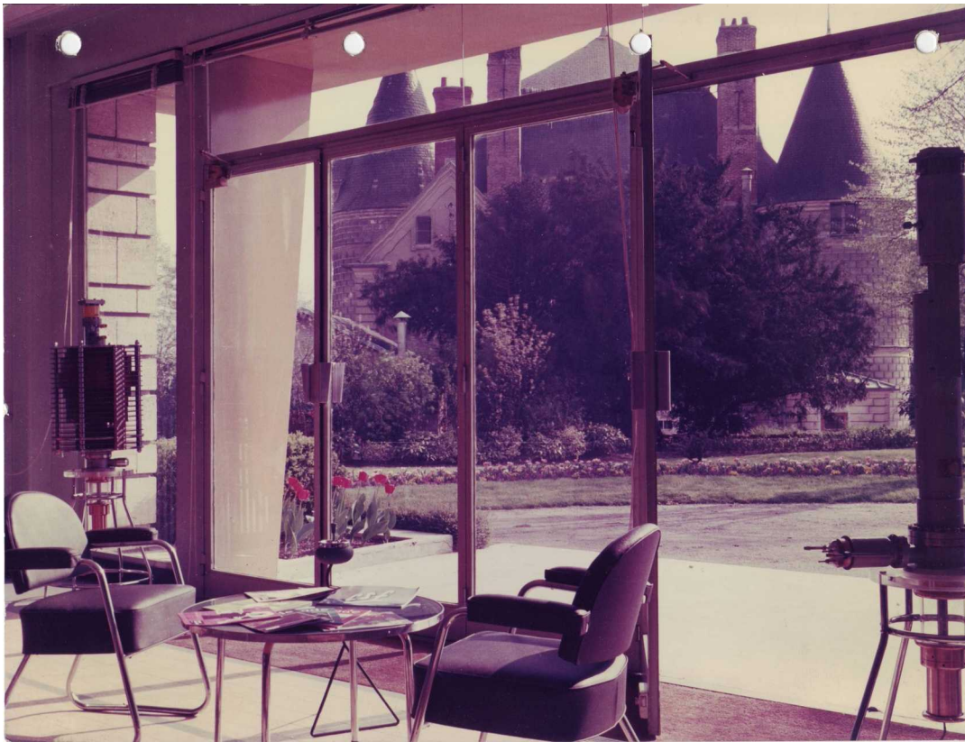
Le hall en bas d'un des bâtiments